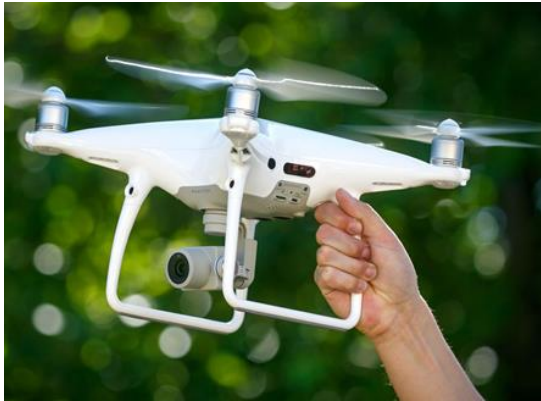
квадрокоптер MAVIC 2 ENTERPRISE ADVANCED