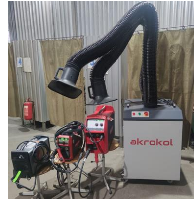
Обладнання електрогазо зварника