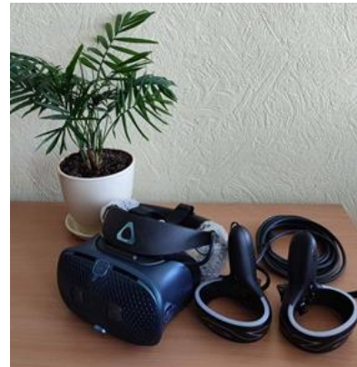
Системи HTC VIVE COSMOS