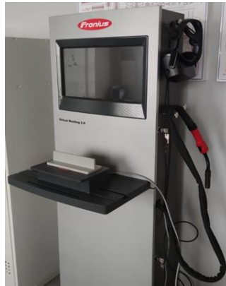
VR тренажер для опрацювання навичок електрогазоварника